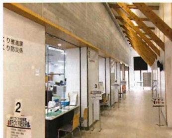
▲目届きのよい行政窓口