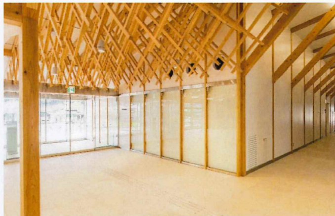
▲エントランスホール天井に設置した宍粟杉による格子細工

事業主 宍粟市 設計者 共同設計株式会社 株式会社山田憲明構造設計事務所 施工者 ハマダ・宮藤特定建設工事共同企業体